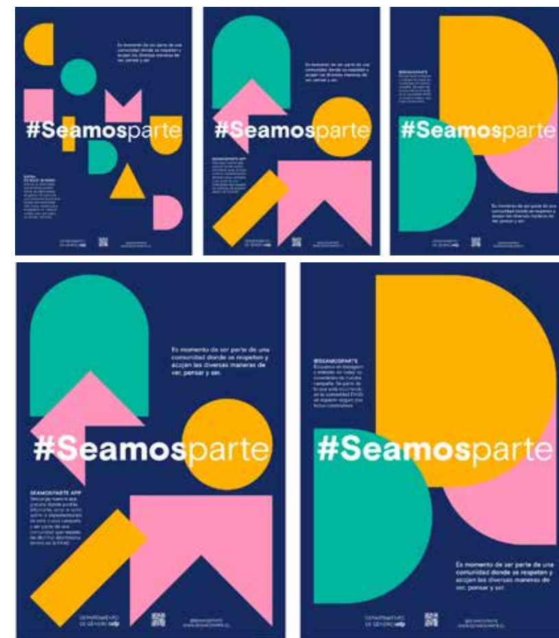
propuesta #2 #SEAMOSPARTE