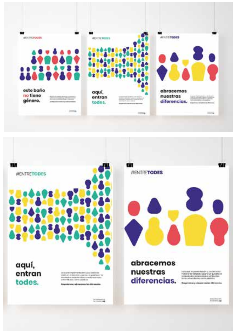
propuesta #1 #ENTRETODES

Conoce más detalles de las propuestas y vota por tu favorita « AQUÍ »